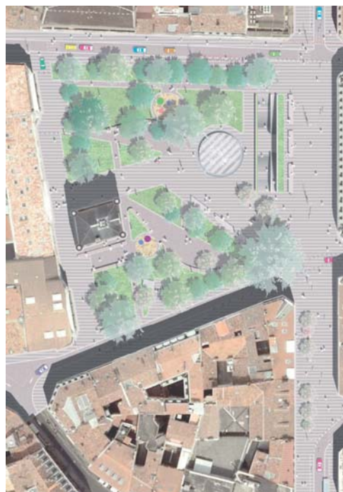
Projet d'aménagement du Square Charles de Gaulle vu du ciel

Un grand plateau commun à tous les usagers, ouvert au centre de la rue, offrira de jour un large parcours clair et aéré. De nuit, la rue Alsace-Lorraine bénéficiera d'une belle mise en lumière grâce à la création de lampadaires sobres et élégants, lesquels pourraient devenir « la signature » du projet.