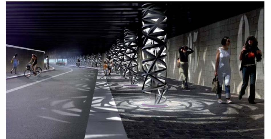
Aménagement de la rue Watt à Paris